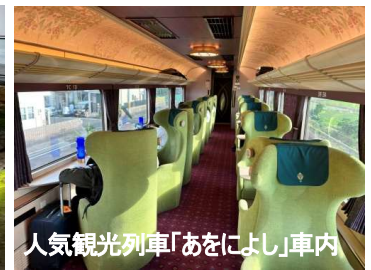
人気観光列車「あをによし」車内