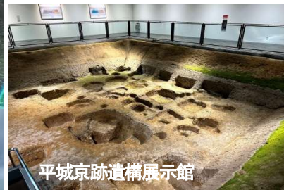
平城京跡遺構展示館

奈良監獄ミュージアム 明治五大監獄で唯一全貌 が現存する重要文化財。 問いかけを巡る美しい監獄 ミュージアムです。