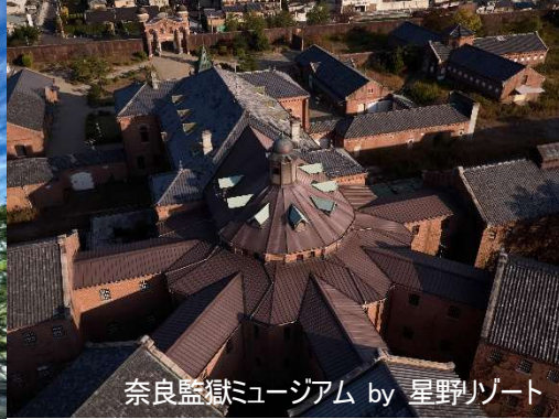
奈良監獄ミュージアム by 星野リゾート