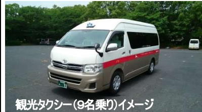
観光タクシー(9名乗り)イメージ

人数により1台 6名から8名様 乗車。添乗員と ドライバーが観 光地などでご案内します。