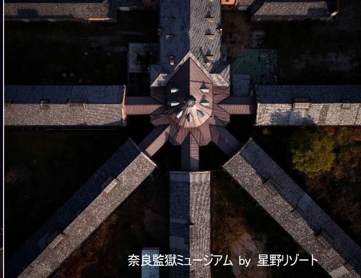
奈良監獄ミュージアム by 星野リゾート