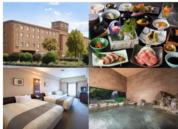
2連泊する奈良ロイヤルホテル 天然温泉大浴場完備

奈良市内の観光地は、駐車の関係で大変歩きます。今回は、素晴らしい仏像、古寺を中心に巡ります。バスが入れない新薬師寺やならまちの元興寺は、ぜひ見ていただきたい古寺です。話題の奈良監獄ミュージアムや、第78回正倉院展にあわせて添乗員同行でご案内します。