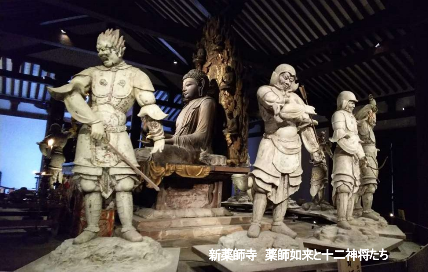
新薬師寺 薬師如来と十二神将たち