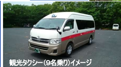
観光タクシー(9名乗り)イメージ

※京都-奈良間は、往路を近鉄特急「あおによし」、復路はJRみやこ路快速を利用予定ですが、復路になることもあります。ご了承下さい。