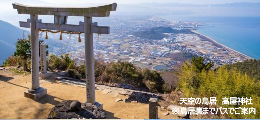
天空の鳥居 高屋神社 ※鳥居裏までバスでご案内

ホテルからの眺め とにかく最高の眺めで、お部屋、テラス、レストラン、大浴場から瀬戸内海、瀬戸大橋などご覧いただけます。