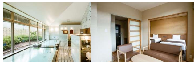
亀の井ホテル観音寺 天然温泉大浴場とお部屋の一例

最少催行人員:8名 食事・朝食2回屋食3回夕食2回 添乗員:1～3日目同行。交通:三豊中央観光バス ※1日目は和洋室海側トイレ付き、2日目は洋室トイレ付きとなります。ベッドの部屋は限りがあります。 3、4名様で参加の場合お問合せ下さい。