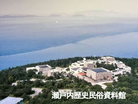
瀬戸内歴史民俗資料館