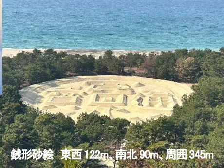
銭形砂絵 東西 122m、南北 90m、周囲 345m