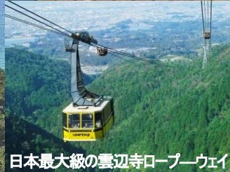
日本最大級の雲辺寺ロープウェイ