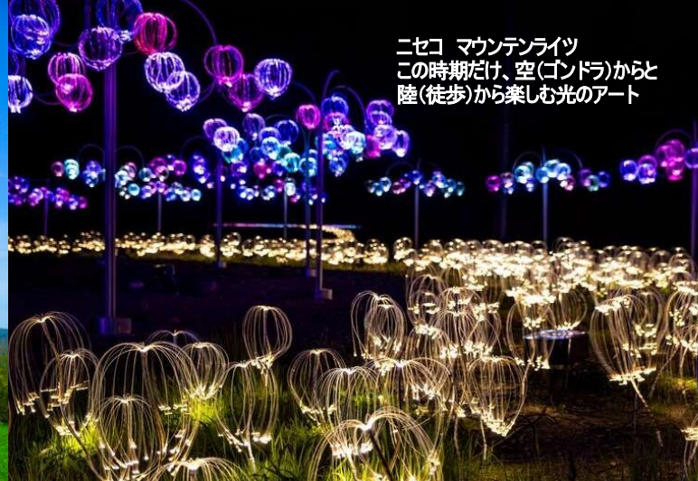
ニセコ マウンテンライツ この時期だけ、空(ゴンドラ)からと 陸(徒歩)から楽しむ光の아트