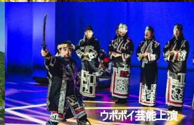
ウポポイ芸能上演