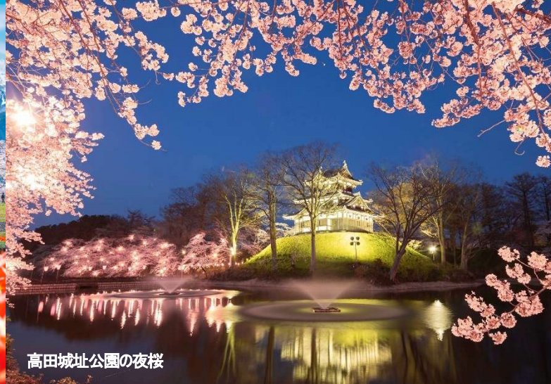
高田城址公園の夜桜