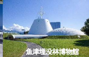
魚津埋没林博物館