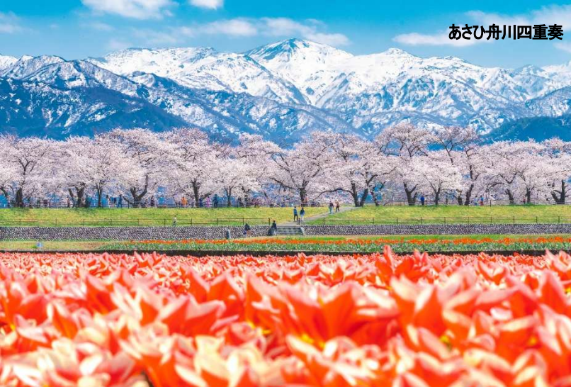
あさひ舟川四重奏