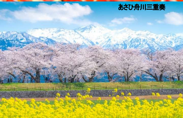
あさひ舟川三重奏