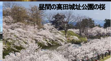
屋間の高田城址公園の桜