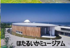
ほたるいかミュージアム