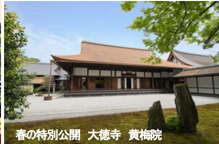
春の特別公開 大徳寺 黄梅院

大阪・関西万博開催を記念した特別展「日本 美のるつぼ-異文化交流の奇跡-」が4/19~6/15まで開催。国宝18件、重要文化財53件を含む約200件の名品をゆづり見学します。