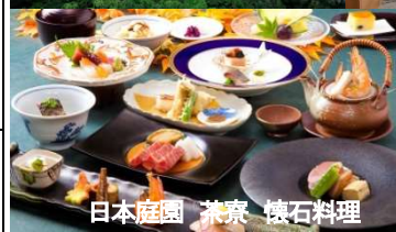
日本庭園 茶寮 懐石料理