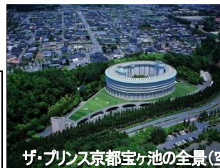
ザ・プリンス京都宝ヶ池の全景(空撮)とお部屋のイメージ