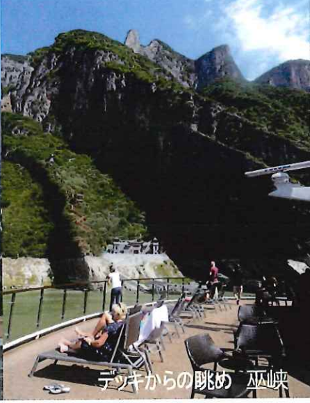
デジキからの眺め 巫峡