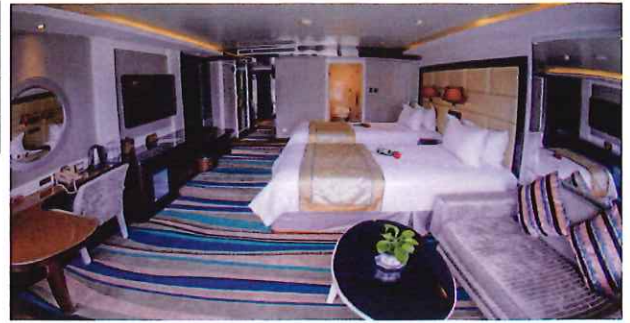
利用するお部屋 エグゼクティブスイート 部屋面積 31㎡ バルコニー、バスタブ付