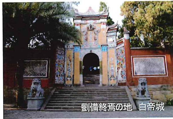
劉備終焉の地 白帝城

長江（揚子江）を下るクルーズ・三峡下りの旅は重慶市内の朝天門から湖北省の宜昌市までの約600kmを、所々の名所に上陸しつつ3日間かけて下っていくこのツアーは、今でも高い人気を集めています。三峡とは、代表的な3つの峡谷「瞿塘峡（くとうきょう）、「巫峡（ふきょう）、「西陵峡（せいりょうきょう）の総称で、この距離は約200km。上陸する場所は主な見所としては、豊都鬼城（冥界の町と呼ばれる）、白帝城（劉備が生涯を終えた地）、神女溪などがあります。そして最後の見学は、三峡ダムでクルーズツアーは終了します。