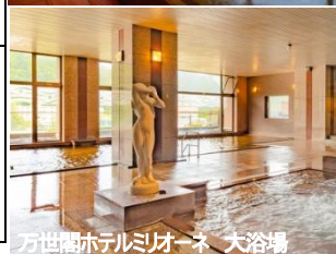
万世閣ホテルミリオーネ 大浴場