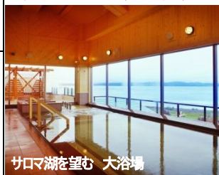
サロマ湖を望む 大浴場

流氷は中国とロシアの国境を流れるアムール川(黒龍江)の真水がオホーツクの海水と混じり氷結し、南下するにつれて大きくなって、毎年1月下旬から3月上旬にかけて北海道オホーツク海岸沿いに移動してきます。利用する砕氷船は大型船で揺れも少なく安心してクルーズをお楽しみいただけることでしょう。また、冬の北海道を代表する祭典「さっぽろ雪まつり」も夕方~夜、昼間の2回訪れ、お楽しみいただけます。雪まつりを象徴する大雪像や中小様々な雪像、氷像、ライトアップなどお楽しみ下さい。