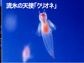
流氷の天使「クリオネ」