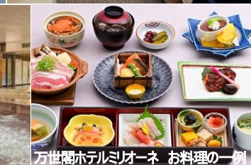
万世閣ホテルミリオーネ お料理の一例