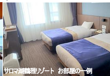
サロマ湖鶴雅リゾート お部屋の一例