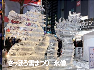
さっぽろ雪まつり 氷像