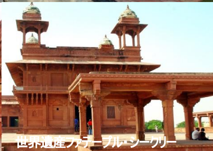
世界遺産ファテール・シークリ