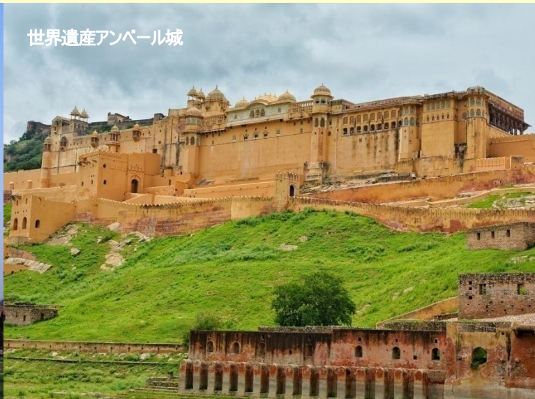
世界遺産アンベール城