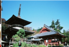
↑桜川 雨引観音 ←あんこう特別会席

120年以上の歴史ある水戸の梅まつり(借楽園と弘道館)と筑波山の梅まつりの時期(2月中旬から3月中旬)にあわせ、温泉ホテルに宿泊しながら、今注目を集めるいばらきのグルメを堪能する旅。冬の味覚を代表する「あんこう特別会席」には、あんこう鍋、あん肝の他、郷土料理のあんこう供酢もご用意。のんびりしているので安心です。