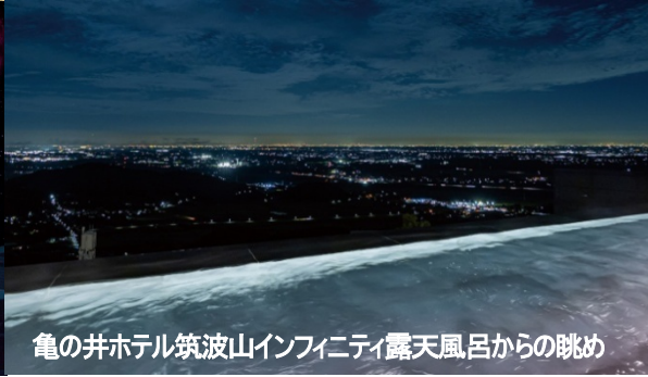
亀の井ホテル筑波山インフィニティ露天風呂からの眺め

新企画 春の訪れ梅の名所、いばらき的美食、温泉を楽しむ 冬の味覚を代表する「あんこう特別会席」も堪能