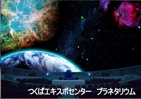
つくばエキスポセンター プラネタリウム