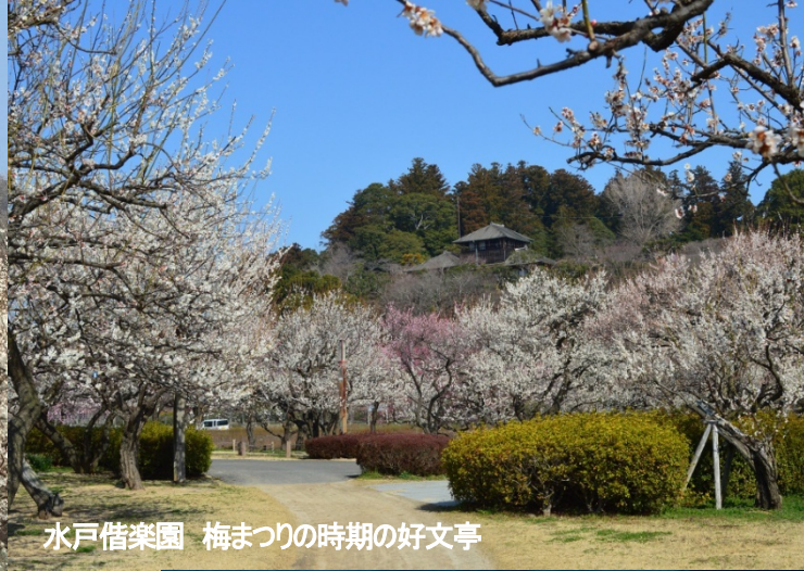
水戸借楽園 梅まつりの時期の好文亭