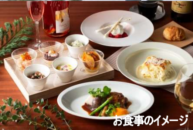
お食事のイメージ