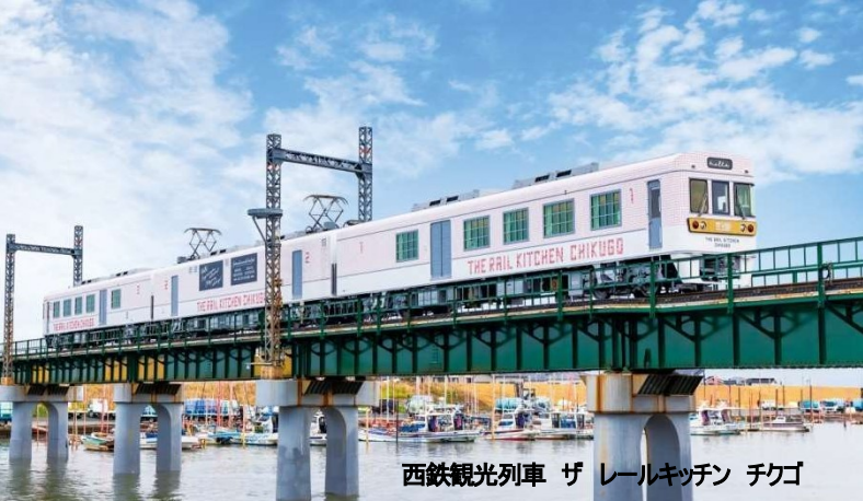
西鉄観光列車 ザ レールキッチン チクゴ