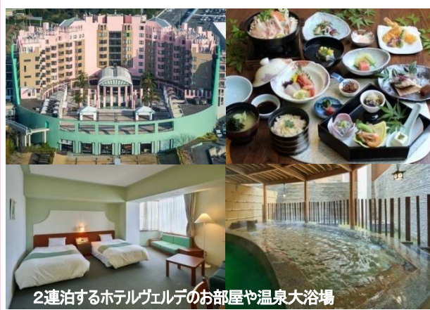
2連泊するホテルヴェルデのお部屋や温泉大浴場

九州最大の遊園地「グリーンランド」に隣接している「ホテルヴェルデ」。天然温泉の大浴場、露天風呂も完備している快適なホテルです。