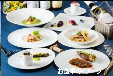
お食事のイメージ