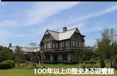
100年以上の歴史ある迎賓館