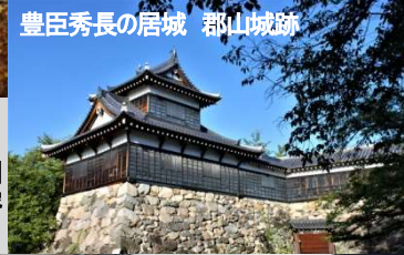
豊臣秀長の居城 郡山城跡