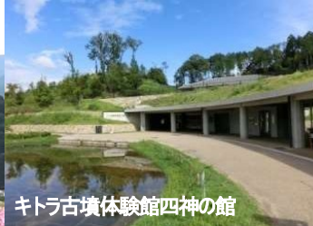
キトラ古墳体験館四神の館