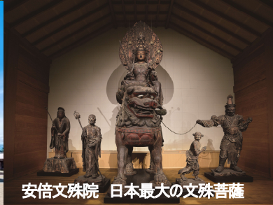
安倍文殊院 日本最大の文殊菩薩