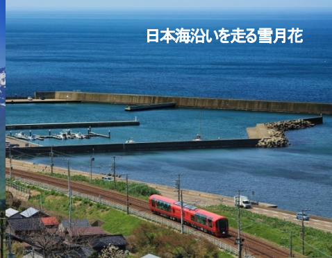
日本海沿いを走る雪月花