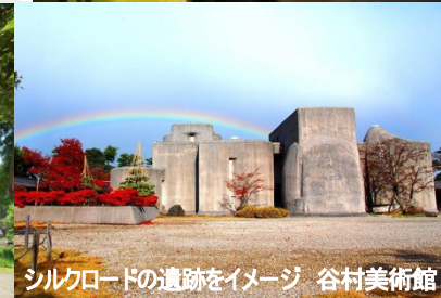
シルクロードの遺跡をイメージ 谷村美術館