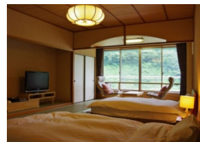
■姫川温泉「ホテル國富 翠泉閣」