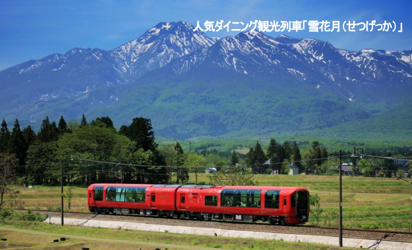
人気ダインング観光列車「雪月花(せつげっか)」