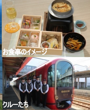
お食事のイメージ