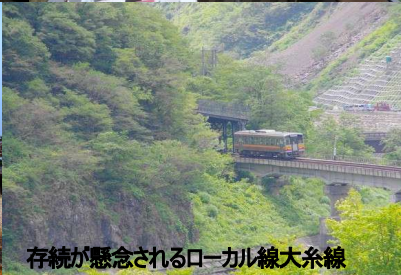
存続が懸念されるローカル線大系線

予約が取れない人気観光列車で知られる「雪月山」を確保！ 新潟の海と山の食と温泉を楽しむ ちょっと贅沢な大人旅