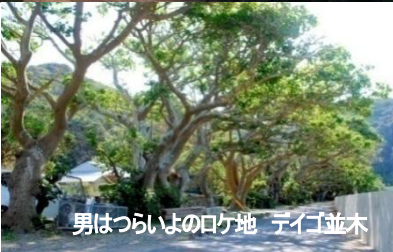
男はつらいよのロケ地 デイゴ並木