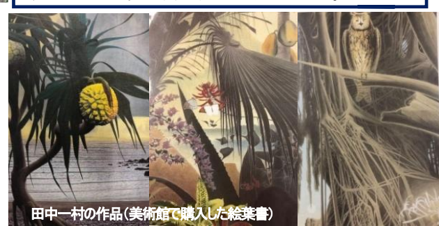
田中一村の作品(美術館で購入した絵葉書)