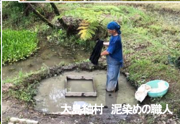
大島紬村 泥染めの職人

奄美大島は、島の大部分が森で、絶滅が危惧される固有種や美しい珊瑚礁が広がり、 2021年7月に世界自然遺産に登録された、今注目の島 といえます。日本のゴーギャン「田中一村」の美術館や大島紬村、「男はつらいよ 寅次郎紅の花」のロケ地・加計呂麻島、奄美の自然を代表するマングローブジャングルの遊覧へご案内します。リゾートホテルに3泊、ゆとりある奄美大島へ行ってみませんか。