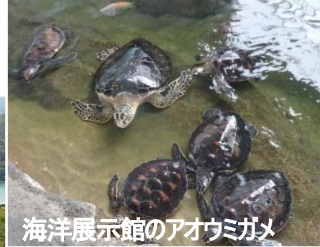
海洋展示館のアオウミガメ