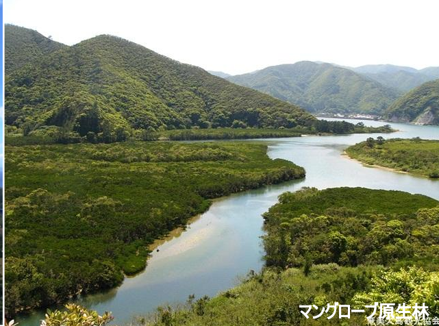
マングローブ原生林