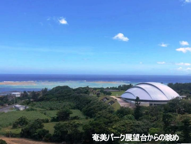
奄美パーク展望台からの眺め