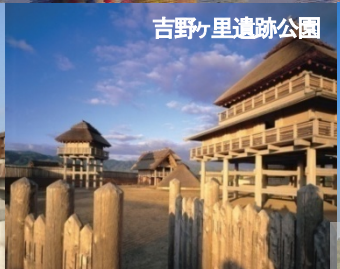
吉野ヶ里遺跡公園