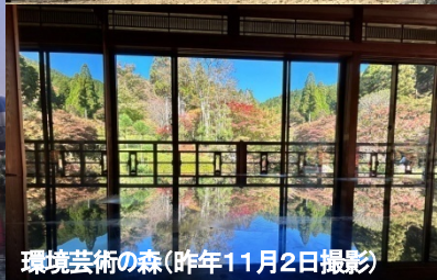
環境芸術の森(昨年11月2日撮影)