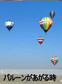
バルーンが上がる時