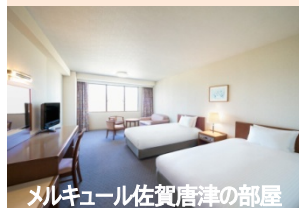
メルキュール佐賀唐津の部屋