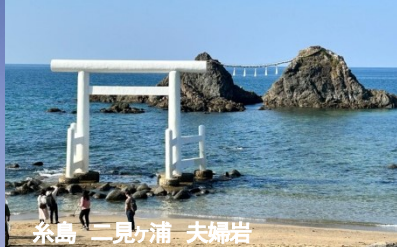
糸島 二見ヶ浦 夫婦岩