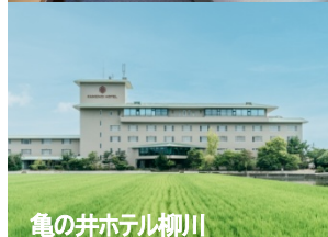
亀の井ホテル柳川