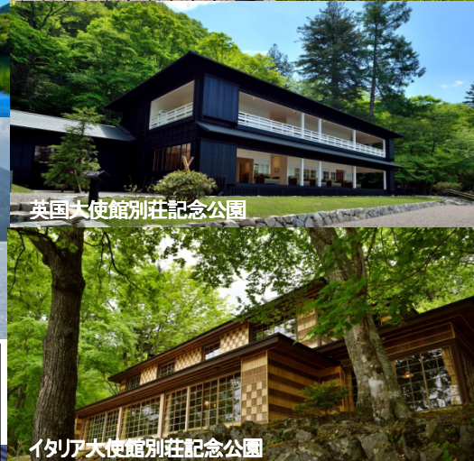
イタリア大使館別荘記念公園