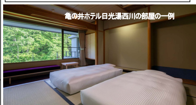
亀の井ホテル日光湯西川の部屋の一例

「亀の井ホテル奥日光湯元」は乳白色の温泉と標高1500mの湯ノ畔にある大自然に囲まれたホテル。「亀の井ホテル日光湯西川」は、弱アルカリ性の美肌の湯で知られ、串打ち囲炉裏焼きのお食事が特色。どちらもベッドのお部屋を確保。