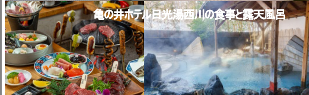
亀の井ホテル日光湯西川の食事と露天風呂

催行人員: 8~12名 食事・朝食2回昼食2回夕食2回 添乗員: 1日目の浅草駅から3日目の浅草駅まで同行。 バス: (株)朝日観光バス ※お部屋は 洋室ですが部屋のタイプが違います。また洋室は部屋数に限りがあるため、なくなった場合和室になります。 ※1日目スペーシア Xは浅草駅集合となり、途中乗車はできません。