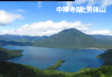
中禅寺湖と男体山

スペーシア X 2023年7月運行開始の新型特急。浅草から東武日光まで乗車。今切符が最も取りにくい列車といえるでしょう。席に限りがあるのでお早めに！