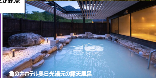
亀の井ホテル奥日光湯元の露天風呂