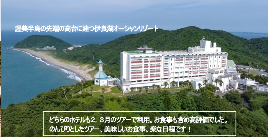
渥美半島の先端の高台に建つ伊良湖オーシャンリゾート

どちらのホテルも2、3月のツアーで利用。お食事も含め高評価でした。 のんびりとしたツアー、美味しいお食事、楽な日程です！