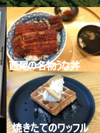
西尾の名物うなぎ