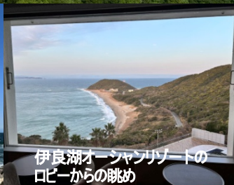
伊良湖オーシャンリゾートの ロビーからの眺め