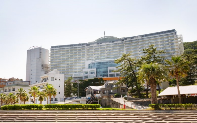
三河湾リゾートリンクスの全景 ↓部屋のベランダからの眺め