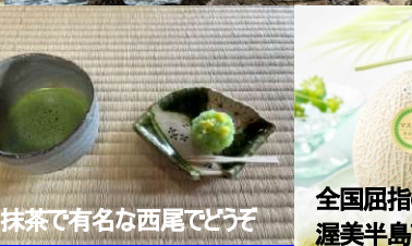
抹茶で有名な西尾でどうぞ