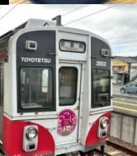
豊橋鉄道の体験乗車

新企画 海沿いの絶景リゾートホテルに宿泊し、美食、天然温泉 を楽しむ旅 ちょっと変わった愛知南部を巡る旅