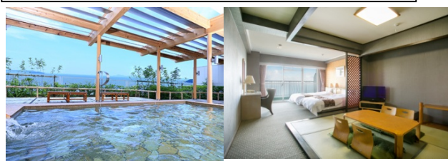
↑三河湾リゾートリンクスの全景と砂浜 お部屋(和洋室)

愛知県の南部の三河湾と渥美半島は、中部地方では大変知られた観光、食の地ですが、意外にも訪れるツアーは少ないのが現状です。2、3月にツアーが発売し、お客様の反応や現地と話をして夏限定ののんびりした旅を企画しました。ホテルは2か所とも天然温泉で全てオーシャンビューのベッドのお部屋を確保しました。お食事にもこだわり、各地の名物をご用意しました。またマスクメロンの時期ですからメロン狩りと熟したメロンもをご用意しました。