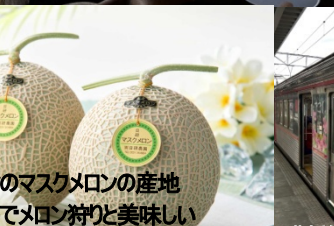
全国屈指のマスクメロンの産地 渥美半島でメロン狩りと美味しい メロンをご用意しました。