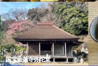
国宝金蓮寺弥陀堂