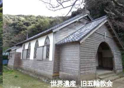
世界遺産 旧五輪教会