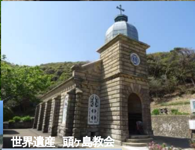
世界遺産 頭ヶ島教会