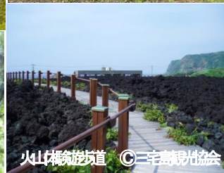
火山体験遊歩道