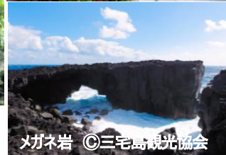
メガネ岩