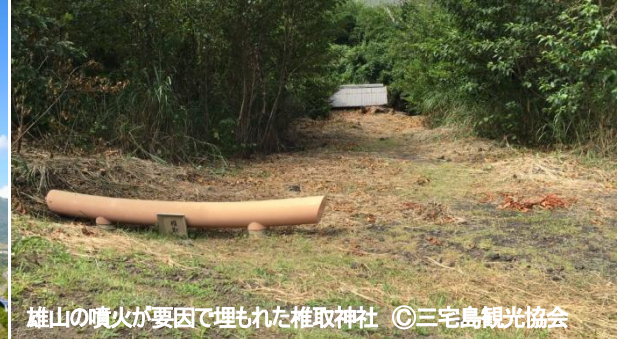
雄山の噴火が要因で埋もれた椎取神社