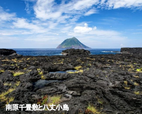
南原千畳敷と八丈小島