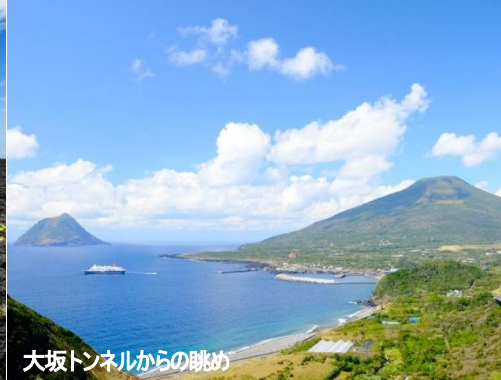
大坂トンネルからの眺め