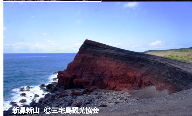
新鼻新山 ©三宅島観光協会

※日程内○太字観光地は入場観光、●太字観光地は下車、車窓観光となります。 ※掲載の写真はイメージです。八丈島観光協会、三宅島観光協会 提供 ※雨や強風など天候により下車観光地は車窓観光となる場合がございます。予め、ご了承下さい。 ※3日目朝、ホテル～港間の移動はホテルの送迎バスを利用します。混乗となります。 ※大型客船は運行状況により大幅な日程変更が生じる場合があります。