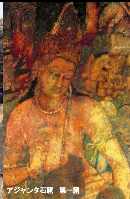
アジャンタ石窟 第一窟