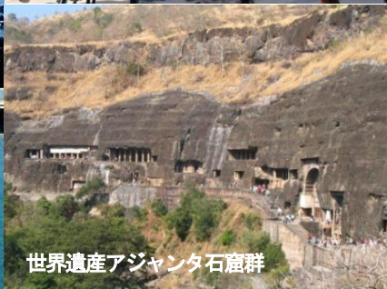
世界遺産アジャンタ石窟群