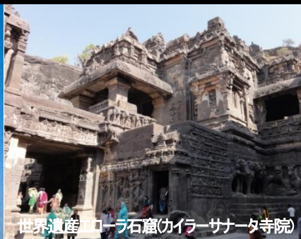
世界遺産 エローラ石窟(カイラサナータ寺院)