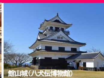
館山城(八犬伝博物館)