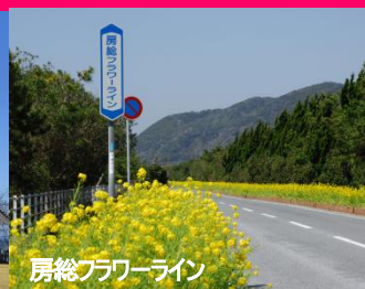
房総フラワーライン