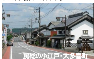
房総の小江戸・大多喜町

■当ツアーは「千葉県誕生150周年記念団体旅行造成支援事業」の支援金支給を前提に特別価格でご提供です。