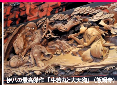
伊八の最高傑作「牛若丸と大天狗」(飯縄寺)