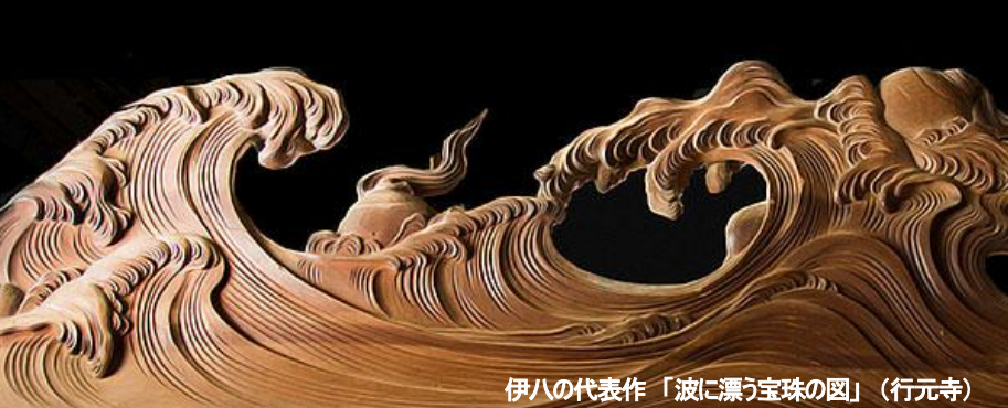
伊八の代表作「波に漂う宝珠の図」(行元寺)