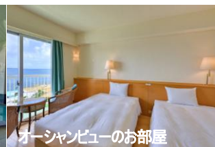
オーシャンビューのお部屋