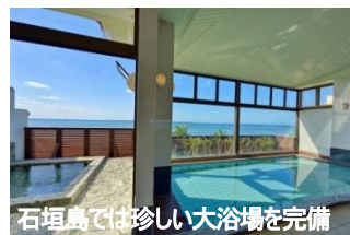
石垣島では珍しい大浴場を完備

人口よりも牛の数が多く、ハートアイランドと称される黒島も西表島などに比べると訪れる機会が少ない島です。のどかな風景はゆったりとした時を感じていただけます。