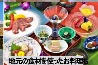
地元の食材を使ったお料理も