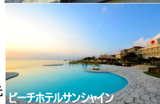
ビーチホテルサンシャイン