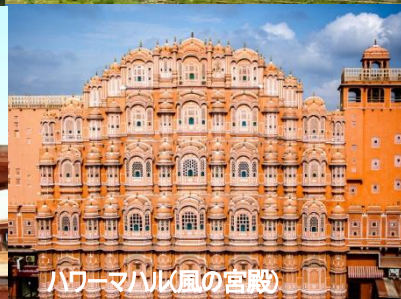
ハワー・マハル(風の宮殿)