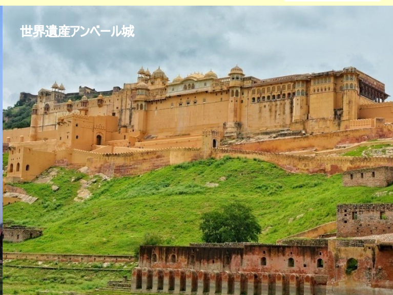
世界遺産アンベール城