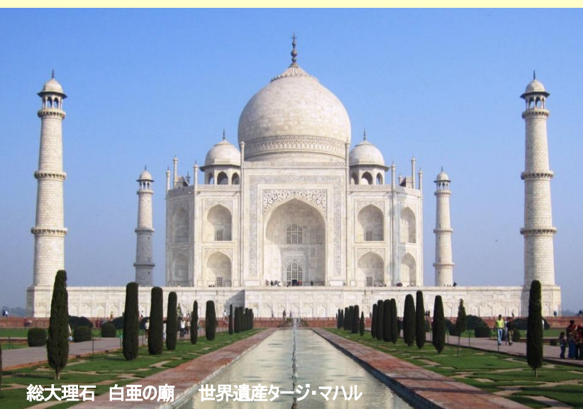
総大理石 白亜の廟 世界遺産タージ・マハル