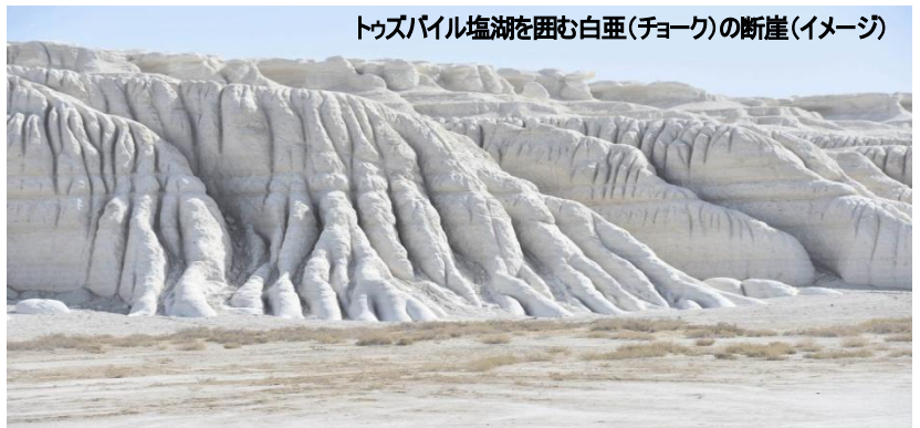
トゥズバイル塩湖を囲む白亜(チョーク)の断崖(イメージ)