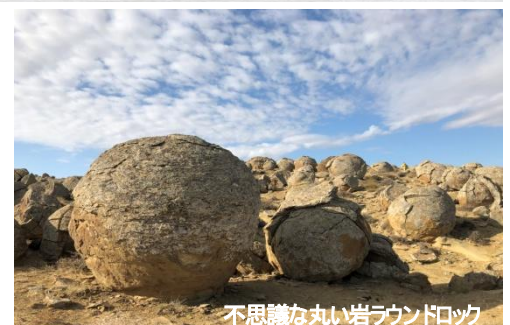
不思議な丸い岩ラウンドロック

お問合せはお客様専用フリーダイヤルへ 東日本 ☎ 0120-813-419 西日本 ☎ 0120-813-770