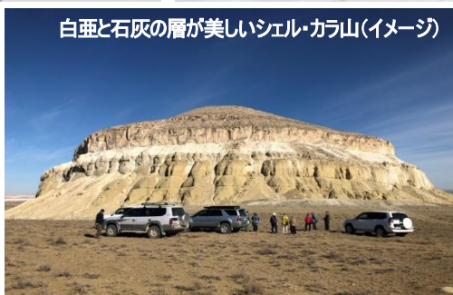
白亜と石灰の層が美しいシェル・カラ山(イメージ)