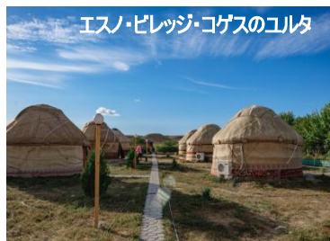
エスノ・ピレッジ・コゲスのユルタ