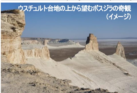
ウスチュルト台地の上から望むボスジラの奇観(イメージ)