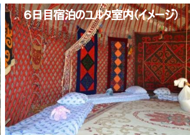
6日目宿泊のユルタ室内(イメージ)

＝ご注意＝ 当コースで訪れる地域には、外務省より「十分注意してください(レベル1)」の危険情報が発出されています。詳しい内容については外務省「海外安全ホームページ」をご覧ください。か、弊社までお問い合わせいただき、申込前に内容をご確認ください。