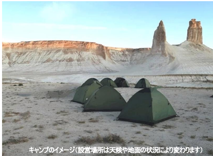
キャンプのイメージ(設営場所は天候や地面の状況により変わります)

※○太字表記の観光地は入場、●太字表記の観光地は下車観光地です。 ※掲載の写真は全てイメージです。天候などにより見え方や印象が異なります。