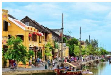
世界遺産・ホイアンの街並み(イメージ)