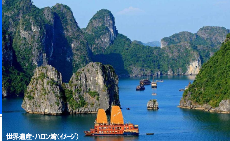
世界遺産・ハロン湾(イメージ)