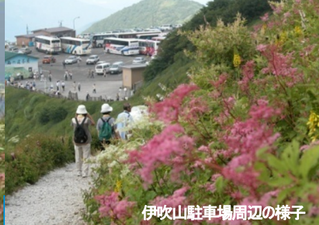
伊吹山駐車場周辺の様子