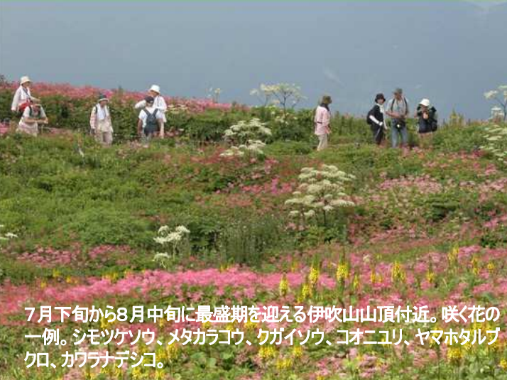
7月下旬から8月中旬に最盛期を迎える伊吹山山頂付近。咲く花の一例。シモツケソウ、メタカラコウ、ウガイソウ、ゴオニユリ、ヤマホタルブクロ、カウラナデシコ。