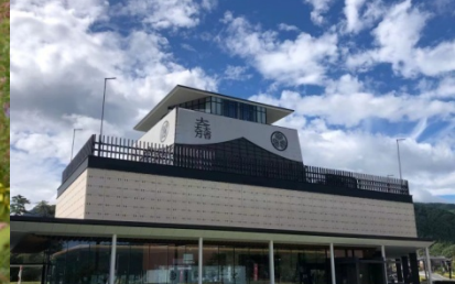
関ヶ原古戦場記念館