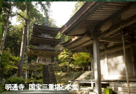
明通寺 国宝三重塔と本堂