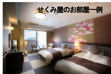
せくみ屋のお部屋一例

夏7、8月にたくさんの高山植物が咲くことで知られる伊吹山。バスで伊吹山ドライブウェイの終点で標高1,260m(伊吹山の9合目付近)まで行き、山頂まで3つのコースがあり最短で20分～40分。お花を見ながらゆっくり登れます。