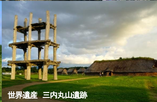
世界遺産 三内丸山遺跡