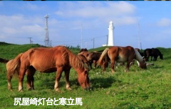
尻屋崎灯台と寒立馬