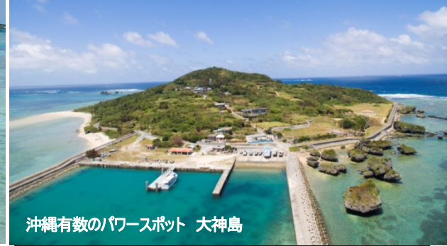
沖縄有数のパワースポット 大神島