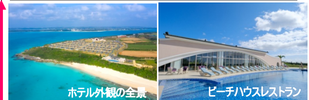
ホテル外観の全景

のんびり、ゆとりをもたせた、忙しくない日程です。きれいな海や自然だけでなく、伊良部島、下地島、来間島、大神島、池間島、宮古の史跡、文化、伝統工芸品などもご覧いただけます。