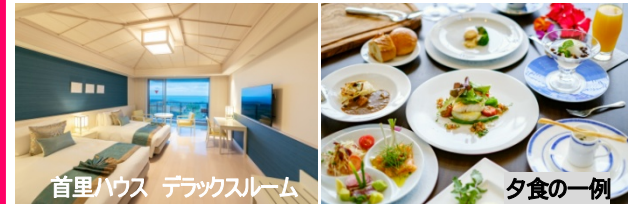
首里ハウス デラックスルーム