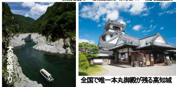
全国で唯一本丸御殿が残る高知城

※日程内○太字表記観光地は入場観光 ●太字表記観光地は下車、車窓観光です。 ※観光列車「四国まんなか千年ものがたり」の運行は、新型コロナウイルス感染拡大状況により、運休になる場合があります。その場合は、特急列車に代えさせていただきます。また、団体枠で座席を確保するため、座席の指定は出来ません。相席になる場合もありますので予めご了承ください。 ※天候や道路状況等により、見学順序や見学場所が変更になる可能性があります。 ※バスは道路幅員の関係から全行程小型バスを利用します。一人2席のスペースはご利用いただけませんので予めご了承ください。