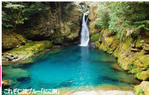
これぞ仁淀ブルー「にこ淵」

四国随一の渓谷美が続く区間を運行する3両編成、乗客定員57名の人気観光列車「四国まんなか千年ものがたり」の香川・琴平駅～徳島・大歩危駅間に乗車し、讃岐山脈や吉野川、スイッチバックの秘境駅・塩尻駅、大歩危・小歩危の渓谷など、車窓から移ろいゆく風景を楽しみます。列車内でいただく地元の名店監修のお食事もお楽しみの一つ。日本三大秘境の一つに数えられる祖谷では、祖谷の一番奥に位置する「奥祖谷の二重かずら橋」や失われつつある原風景とも言える「落合集落」を見渡せる展望所など、祖谷に宿泊しなければなかなかご覧いただけない場所にも訪問。また、水質日本一に選ばれ、「奇跡の清流」として知られる仁淀川へも高知市内から日帰りで訪れ、「仁淀ブルー」と呼ばれる美しい水の色と渓谷美を満喫します。