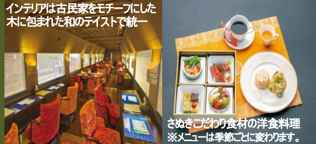
インテリアは古民家をモチーフにした木に包まれた和のテイストで統一