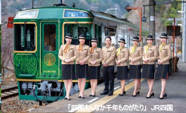
「四国まんなか千年ものがたり」 JR四国