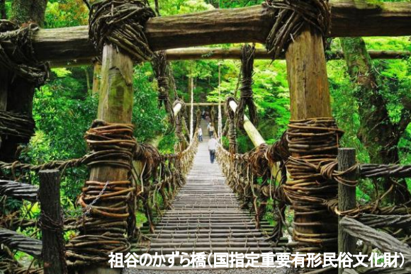
祖谷のがずら橋(国指定重要有形民俗文化財)