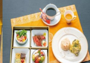
さぬきこだわり食材の洋食料理 ※メニューは季節ごとに変わります。

四国随一の渓谷美が続く区間を運行する3両編成、乗客定員57名の人気観光列車「四国まんなか千年ものがたり」の香川・琴平駅～徳島・大歩危駅間に乗車し、讃岐山脈や吉野川、スイッチバックの秘境駅・塩尻駅、大歩危・小歩危の渓谷など、車窓から移ろいゆく風景を楽しみます。列車内でいただく地元の名店監修のお食事もお楽しみの一つ。日本三大秘境の一つに数えられる祖谷では、祖谷の一番奥に位置する「奥祖谷の二重かずら橋」や失われつつある原風景とも言える「落合集落」を見渡せる展望所など、祖谷に宿泊しなければなかなかご覧いただけない場所にも訪問。また、水質日本一に選ばれ、「奇跡の清流」として知られる仁淀川へも高知市内から日帰りで訪れ、「仁淀ブルー」と呼ばれる美しい水の色と渓谷美を満喫します。